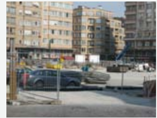
Onderbreking in de omheining voor de doorgang van bouwvoertuigen en -machines.

5° de plantputten moeten tijdens de werkuren van de bouwplaats bereikbaar blijven.