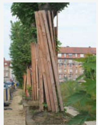
Voorbeeld van bescherming van bomen.

3° wordt het vrijkomen van stof afkomstig van de bouwplaats tot een minimum beperkt, onder andere aan de hand van dekzeilen en besproeiing.