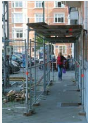
Doorgang beschermd tegen vallende materialen.

§ 5. Indien de omgeleide doorgang voor de voetgangers niet kan worden ingericht langs de bouwplaats, wordt het voetgangersverkeer omgeleid naar het trottoir aan de overkant. In dat geval wordt een passende wegmarkering aangebracht opdat de voetgangers de weg veilig zouden kunnen oversteken. Naargelang van de dichtheid en snelheid van het verkeer wordt die wegmarkering aangevuld met verkeerslichten die met een drukknop worden bediend.