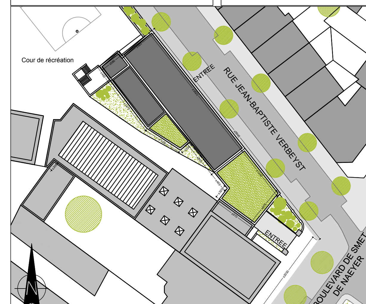
Plan - zones d'intervention - 1/500