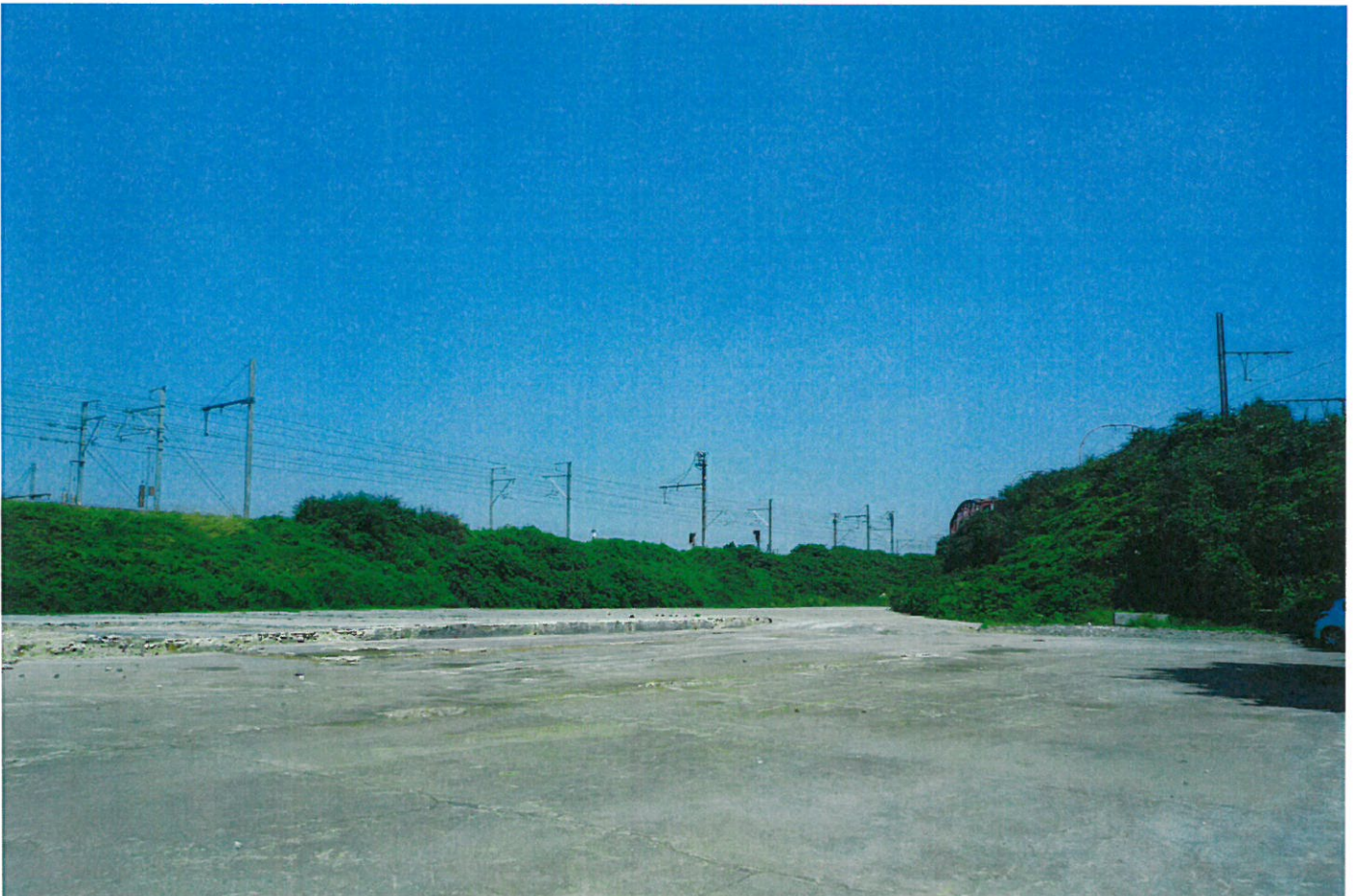
VUE 2 : VUE DEPUIS LE FUTUR PARC DE DIVERCITY COTÉ AVENUE DU PONT DE LUTTRE