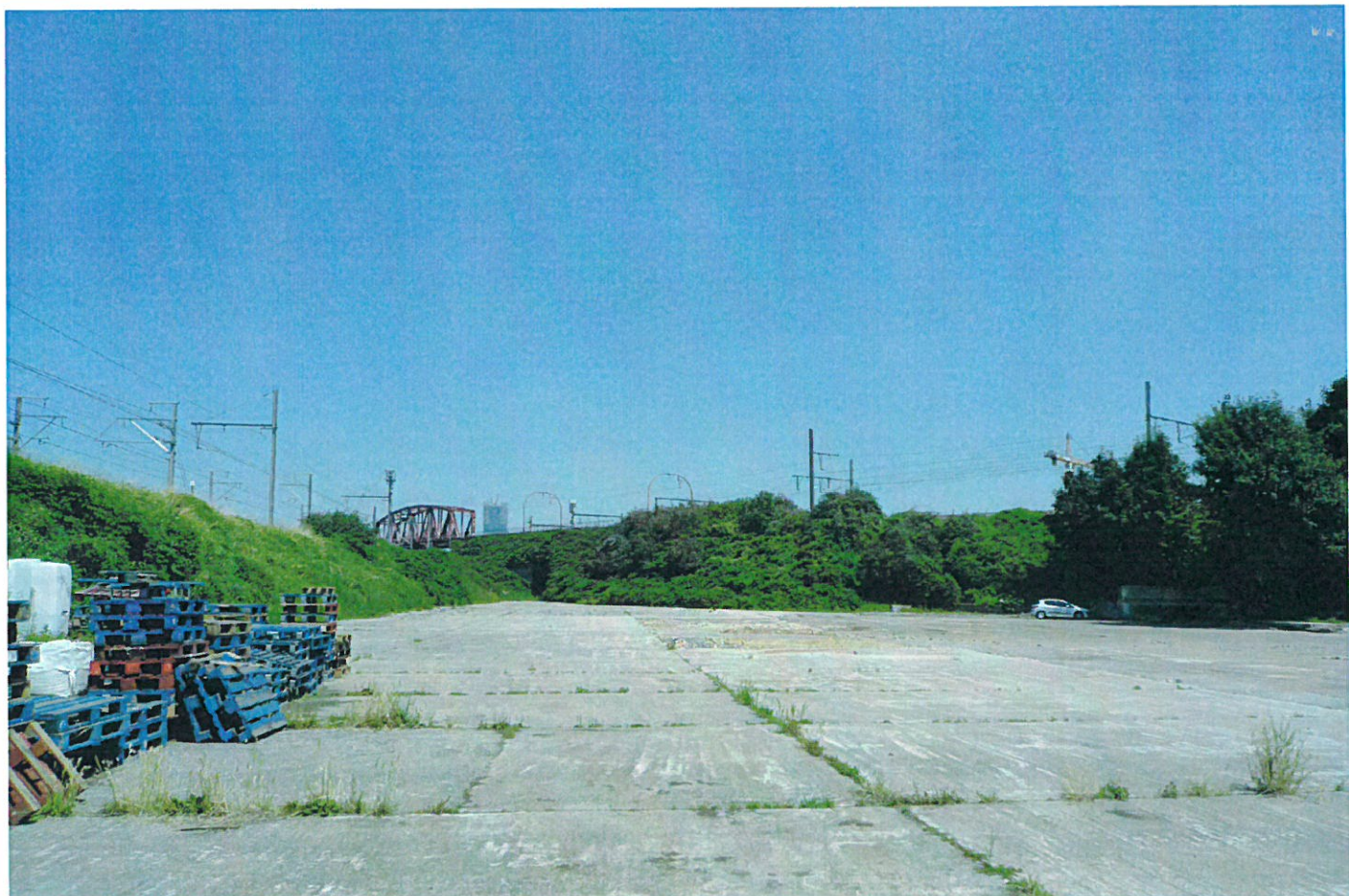
VUE 3 : VUE DEPUIS LE FUTUR PARC DE DIVERCITY COTÉ RUE SAINT DENIS