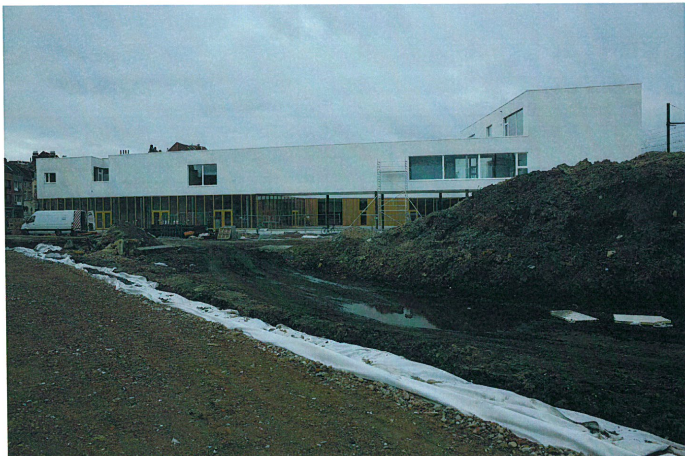
VUE 4 : VUE DEPUIS LE FUTUR PARC SUR LE BATIMENT DE DIVERCITY