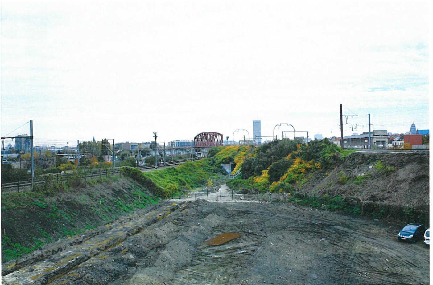
VUE 5 : VUE DEPUIS LA TOITURE DU BATIMENT DE DIVERCITY SUR L'ENSEMBLE DU SITE DE LA NOUVELLE ECOLE