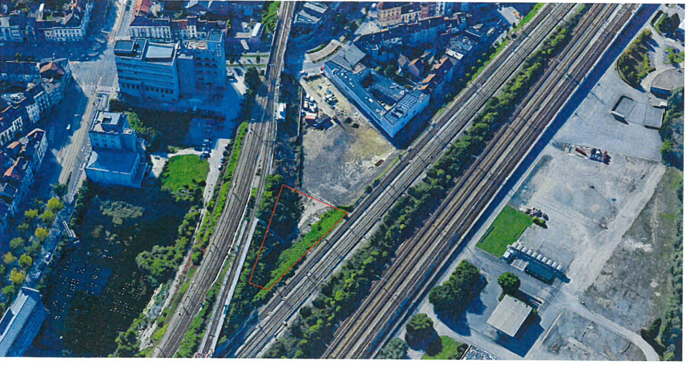
VUE AXONOMETRIE NORD/OUEST