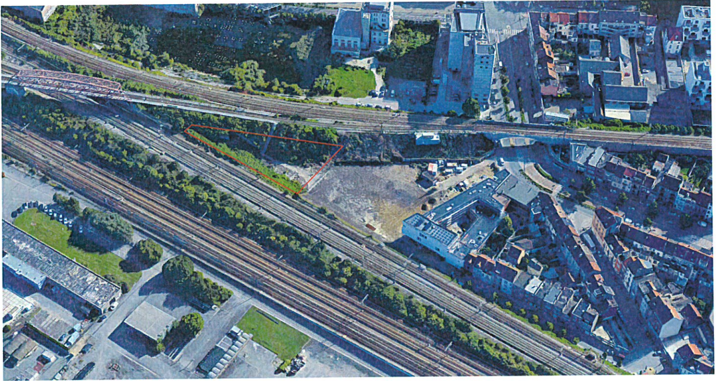
VUE AXONOMÉTRIE SUD/OUEST