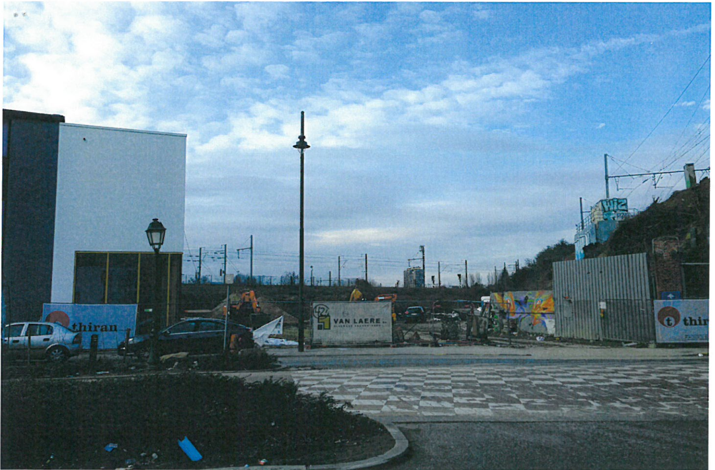
VUE 1 : VUE DEPUIS L'ENTRÉE DU SITE DE DIVERCITY 140 AVENUE DU PONT DE LUTTRE