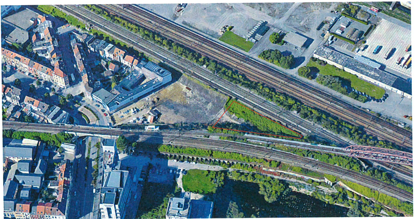
VUE AXONOMÉTRIE NORD/EST