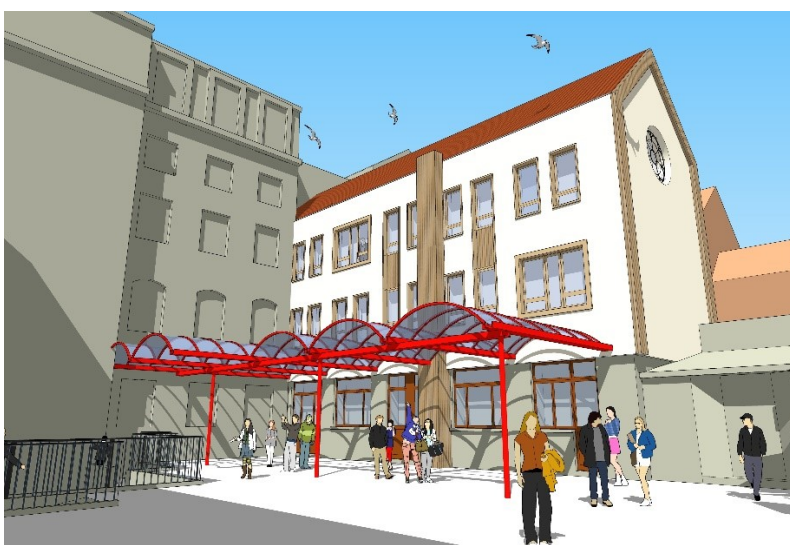
Après travaux envisagés.