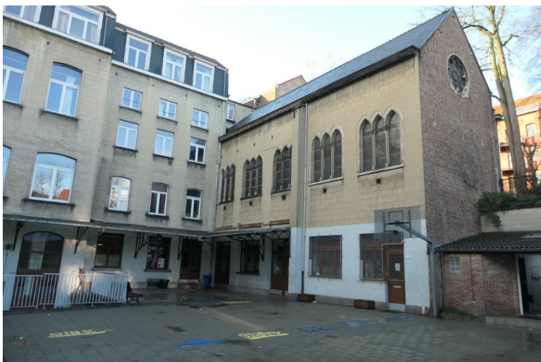
Avant travaux envisagés.