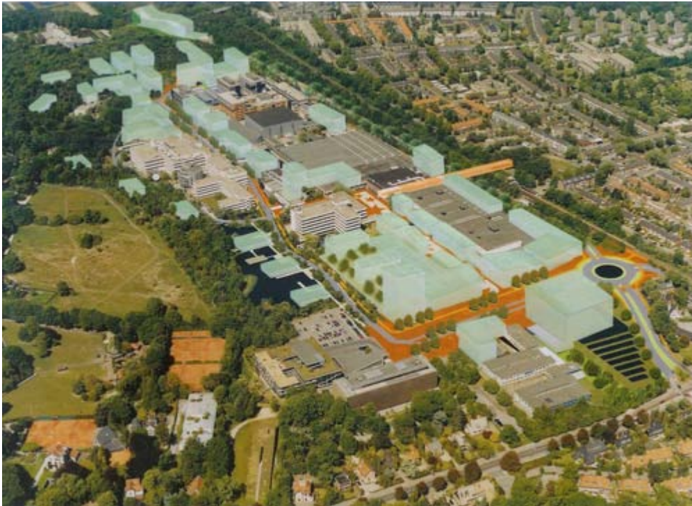
Figure 2 : Masterplan du TCN Media Park à Hilevrsum, fin probable en 2020

TCN Media Park (TCN) est une société immobilière internationale créé en 1974 . Elle accueille un certain nombre d'entreprises travaillant dans le secteur des médias et de la production audiovisuelle. Ces entreprises louent des bureaux sur le site du parc (partie Nord). Le site propose également des infrastructures pour l'organisation d'évènements et différents studios pour l'enregistrement des émissions TV. Le site offre parallèlement des services de soutien comme les services de garde d'enfants ou de fitness.