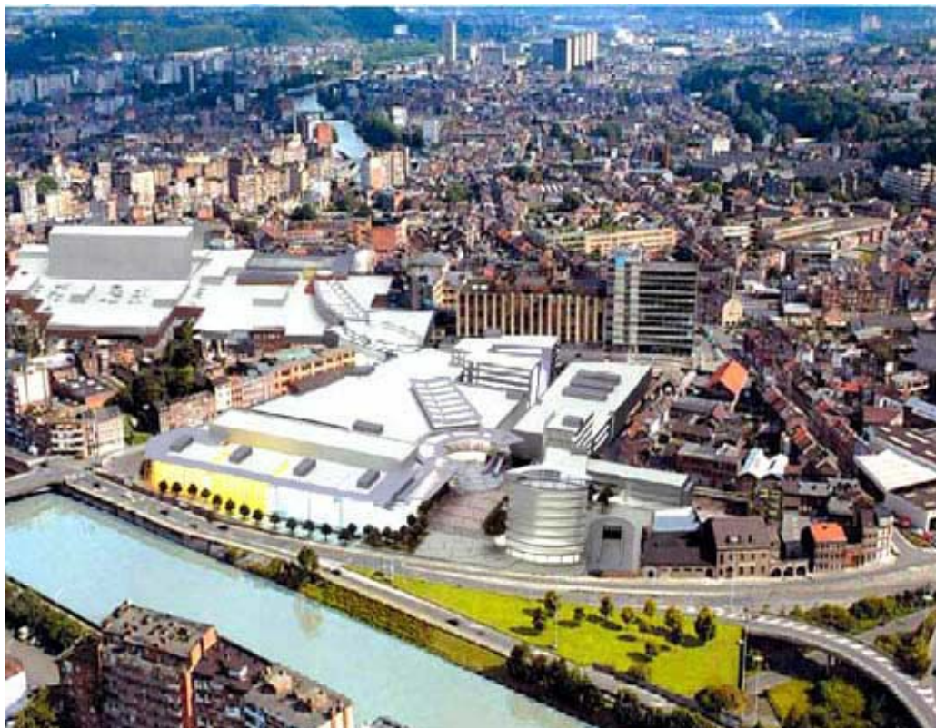
Figure 7 : Perspective du projet MédiaCity à Liège