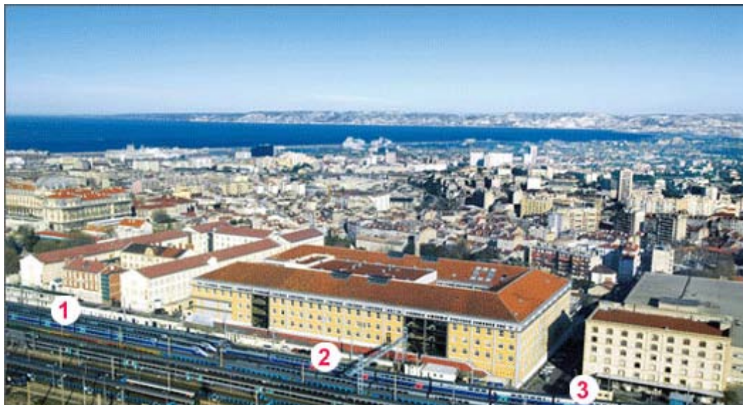
Figure 5 : Panorama du site Belle-de-Mai à Marseille

Initiative analysée (monographie) dans le cadre du projet IRIS (Initiatives Régionales Innovations et Stratégies, France) ; rédigée par LAVOCAT Eric publié le 12 août 2003 (pour accéder à la monographie : voir http://www.oten.fr/?article1040 )