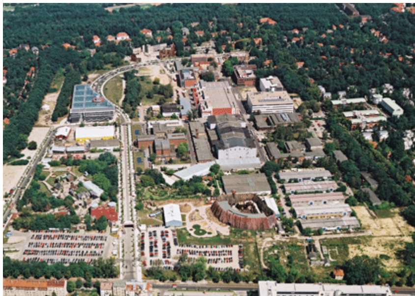
Figure 4 : Vue aérienne du site de Babelsberg Studio

En 1992, la Compagnie Générale des Eaux achète les studios de Babelsberg. Au même moment, une des deux télévisions régionale du nouveau Land s'y installe. Depuis cette date, les visites touristiques des mythiques studios rencontrent un certain succès. La partie touristique occupe à elle seule 120 personnes. En 1993 , un énorme projet propose de transformer les studios en « parc média » sous la direction d'Euromedien, une coentreprise de la Générale des Eaux et de la CIP. Babelsberg est alors divisé en différentes structures. Les lieux de tournage emploient 260 personnes.