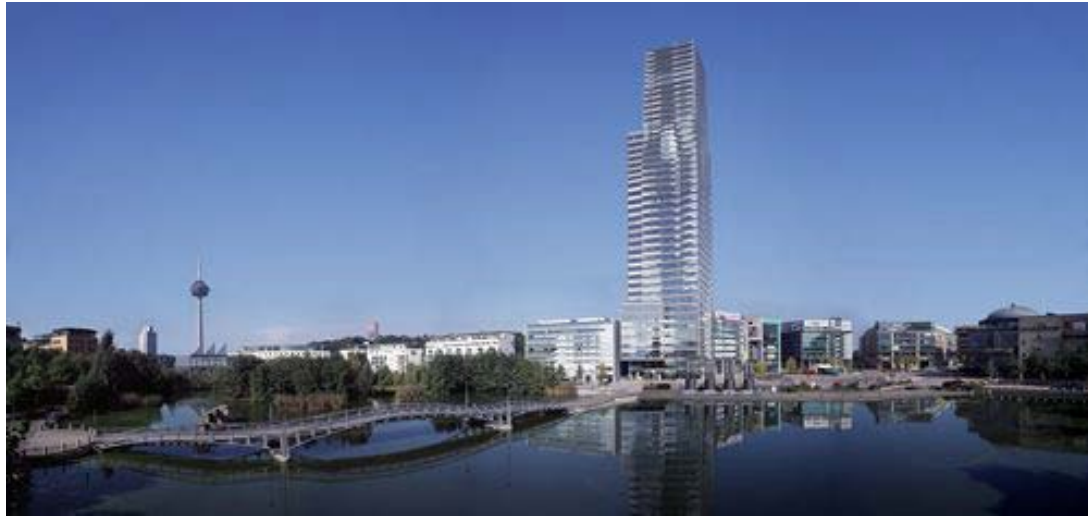
Figure 3 : MediaPark-Panorama

Le Média Park en né en 1986 et a été créé lors de la réaffectation d'un quartier urbain à l'abandon. Aujourd'hui environ 5000 personnes travaillent dans 250 entreprises situées dans le MediaPark de Cologne. Il y a environ 4,5 millions de visiteurs par an. En plus des milliers de visiteurs, le Cinedom attire aussi l'international film Premieres de Cologne.