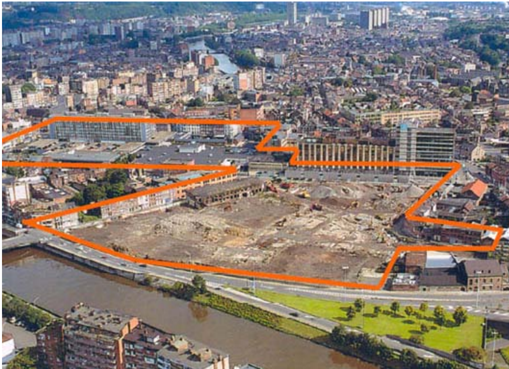
Figure 6 : Limite du terrain consacré au projet MédiaCity à Liège