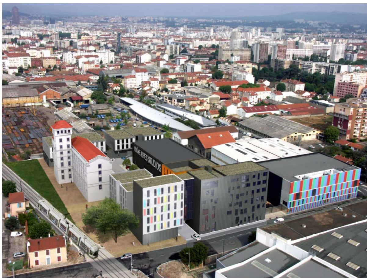
Figure 8 : Perspective du projet PIXEL à Lyon

Nouveau pôle audiovisuel, PIXEL est en cours de construction à Villeurbanne. En perspective, 10 000 m 2 de bureaux et d'activité à Lyon-Villeurbanne dont la livraison s'échelonne de novembre 2008 à mars 2009.