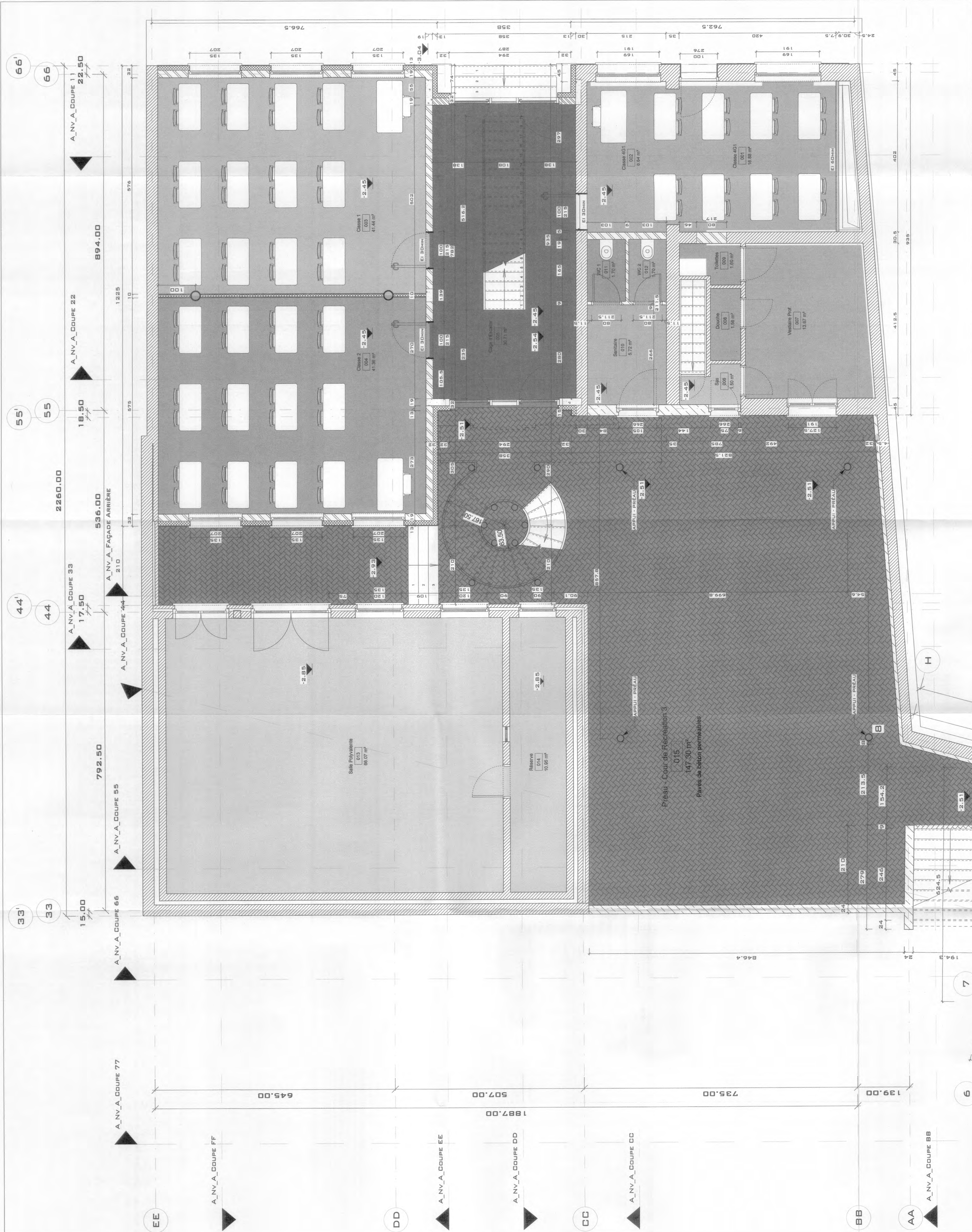
Légende des Pièces (-2.07)