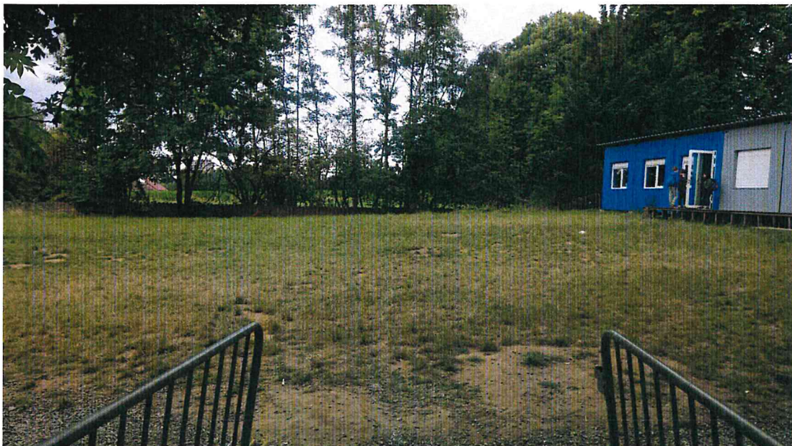
F03 : Zicht naar de site voor de toekomstige klascontainers

Aanvraag van een stedenbouwkundige vergunning voor het plaatsen van 3 tijdelijke klascontainers in de Sint-Janskruidlaan 14 te Anderlecht