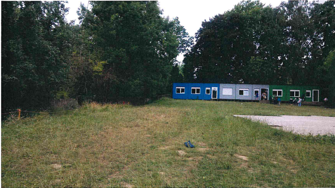
F01 : Zicht naar bestaande klascontainers

Aanvraag van een stedenbouwkundige vergunning voor het plaatsen van 3 tijdelijke klascontainers in de Sint-Janskruidlaan 14 te Anderlecht