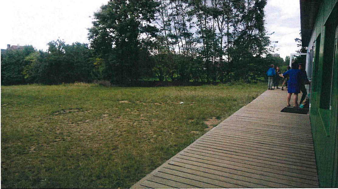
F05 : Zicht vanop houten terras bestaande klascontainers

Aanvraag van een stedenbouwkundige vergunning voor het plaatsen van 3 tijdelijke klascontainers in de Sint-Janskruidlaan 14 te Anderlecht