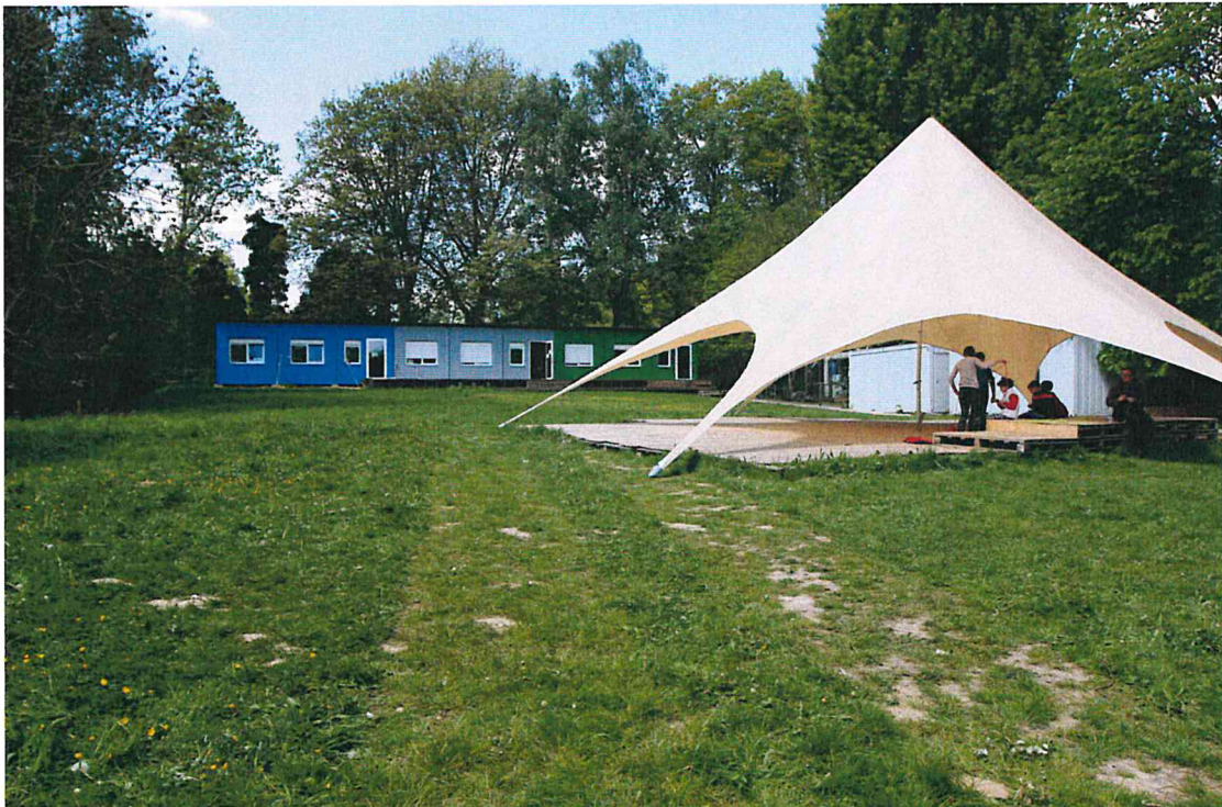
F06 : Zicht op site bestaande klascontainers