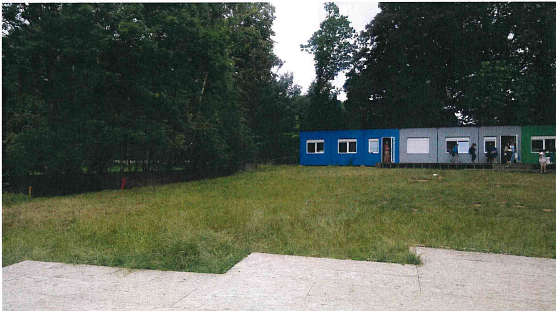
F02 : Zicht naar bestaande klascontainers